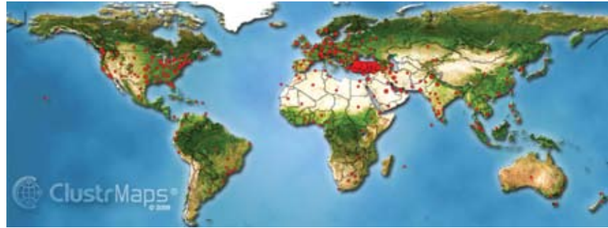
Şekil-2 ODTÜ Açık Ders Malzemelerine Ulaşan Ülkeler (Kırmızı noktalar ziyaret yoğunluğunu göstermektedir)

ODTÜ'lü öğretim üyelerinin açtığı derslerden yararlanmış. Şekil-2 ve Tablo-1'de ODTÜ derslerinden yararlanan kişilerin ülkeleri ve en çok ziyaret eden 10 ülkenin bilgisi verilmektedir.